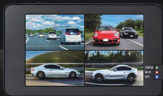
メインコントローラー